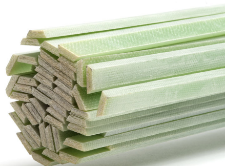
Spårlist, trapets G11 glasvävepoxy