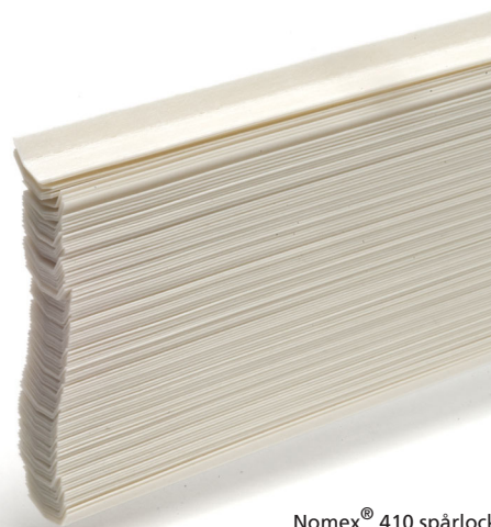
Nomex® 410 spårlock